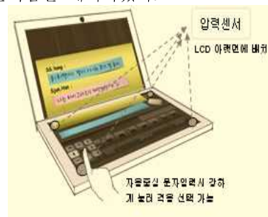
그림 1 제안된 문자입력 인터페이스

본 논문에서 제안한 심플키는 자음을 중심으로 하는 터치 제스처 기반의 문자입력을 제안하며 제스처 하나로 자음과 모음을 동시에 입력하는 것이 가능하다. 사용예로서 그림 1 처럼 사용자가 자음을 선택하면 8 방향의 모음(격음포함)이 제시되며 제시된 모음으로의 스토록을 통하여 자음과 모음을 동시에 입력한다. 그리고 구현된 심플키는 8.9 인치 크기의 LCD 사이즈에서 구현되었으며 이는 미국 성인남자 인덱스 평가 사이즈가 2 센치미터인 것을 고려하여 9 개의 입력영역을 배치하였으며 심플키에서는 9 개의 입력영역에 기본자음을 배치하였다.