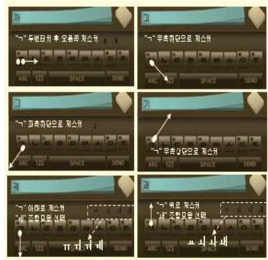
그림 3 심플키 사용예

그림 4 는 8.9 인치 모발디바이스상에서의 터치제스처기반의 자음중심문자입력 인터페이스의 실제 구현 예이다.