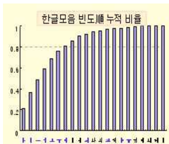
그림 2 한글모음 빈도순 누적비율

제안된 방식에서 8 방향의 모음은 모음별 특징 획만을 고려하여 모델링을 하였으며 최대 빈도 모음 7 개를 포함한 11 개(누적빈도 85%)에 대하여 한번의 제스처로 입력이 가능하다. 누적빈도 85% 이외의 나머지 조합모음들에 대한 입력방식은 그림 3 처럼 4 개의 조합모음선택 제시를 통하여 입력할 수 있다. 기본 8 방향 모음선택 이후에는 모든 조합을 고려할 경우 최대 4 개 이하의 조합모음이 존재한다. 4 개 아이템의 선택은 사람이 한번에 인지할 수 있는 수로 제스처 이상의 효과를 볼 수 있다. 그림 2 는 한글 모음 사용빈도 순서를 고려한 누적 비율을 보여준다.